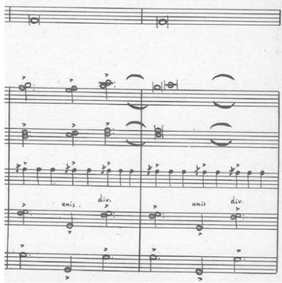
Resim 12. “Cəngi” adlı eserin klasik gitar uyarlaması, 85. ve 86. ölçüler