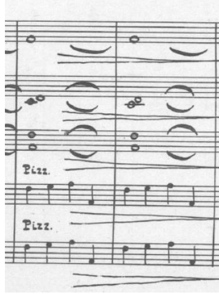
Resim 8. “Cəngi” adlı eserin klasik gitar uyarlaması, 47. ve 48. ölçüler