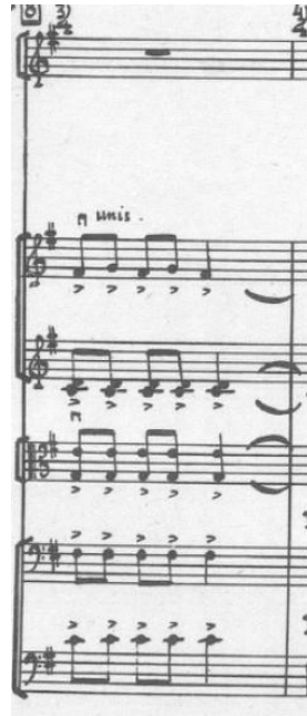
Resim 6. “Cəngi” adlı eserin klasik gitar uyarlaması, 46. ölçü