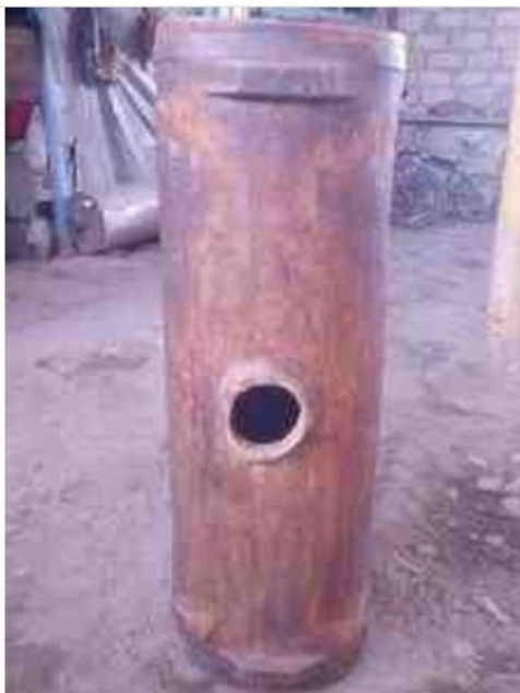
Şəkil 1. Nehrə.

Musiqi nümunələrinin təhlilinə keçməzdən öncə nehrə havalarının yaranmasında rol oynayan əmək şəraiti haqqında məlumat verməyi məqsədəuyğun hesab edirik. Qədim zamanlardan yağ hazırlamaq üçün əməksevər qadınlarımız nehrə çalxalayardılar [2].